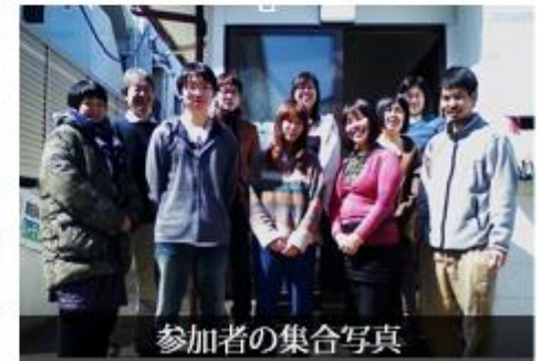
参加者の集合写真