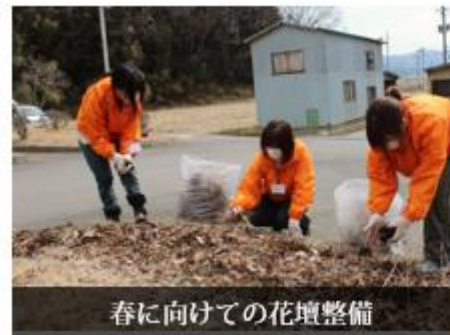
春に向けての花壇整備