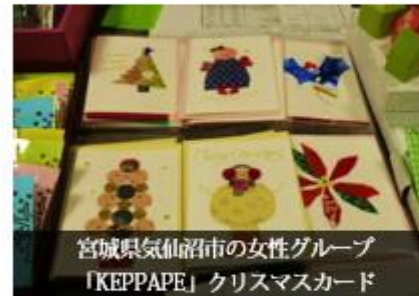
宮城県気仙沼市の女性グループ 「KEPPAPE」クリスマスカード