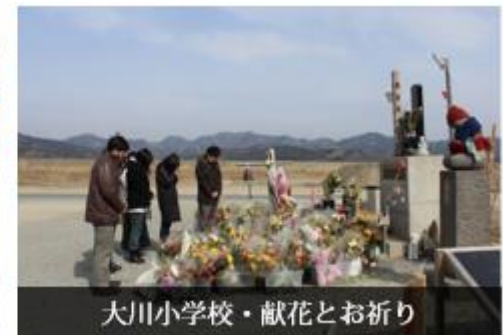
大川小学校・献花とお祈り