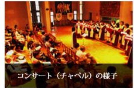
コンサート（チャペル）の様子