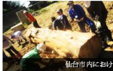
仙台市内における瓦礫の撤去作業