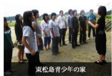
東松島青少年の家