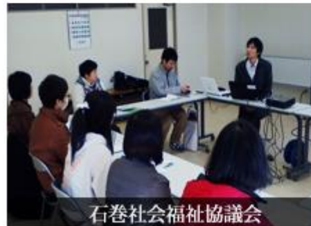
石巻社会福祉協議会