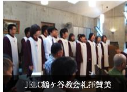
JELC鶴ヶ谷教会礼拝讃美

る参加者と共に蝋燭に灯った主の復活の火が交わされ、復興への祈りがあわされました。また聖歌隊は、その礼拝後に、大きな被害に遭った2010年度の合宿地「東松島青少年の家」を訪問しました。たった数ヶ月前、合宿で過ごした地の変り果てた悲惨な有り様に驚き、悲しみつとも詩篇23篇「主はわが牧人」を歌い、亡くなった方たちに神様の導きと慰めを覚えて祈りました。