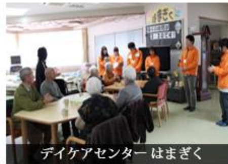
デイケアセンターはまぎく