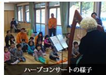
ハーブコンサートの様子