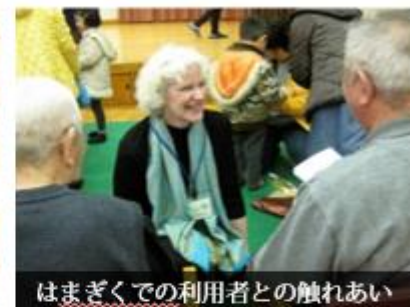
はまぎくでの利用者との触れあい