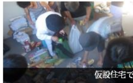
仮設住宅での支援物資配布