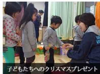
子どもたちへのクリスマスプレゼント