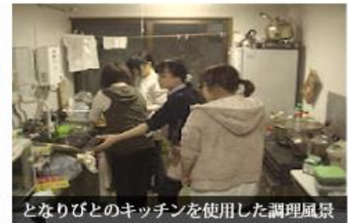
となりびとのキッチンを使用した調理風景