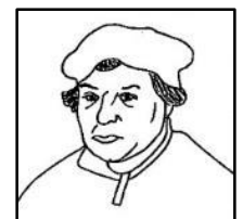
☆ブーゲンハーゲン