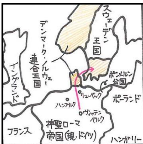
☆宗教改革時代のブーゲンハーゲン活動地図

やがてルター派を支持するデンマーク王クリスチャン 3 世に招かれて王の戴冠式を執り行い、デンマーク・ノルウェー王国の宗教改革を整えていきました。